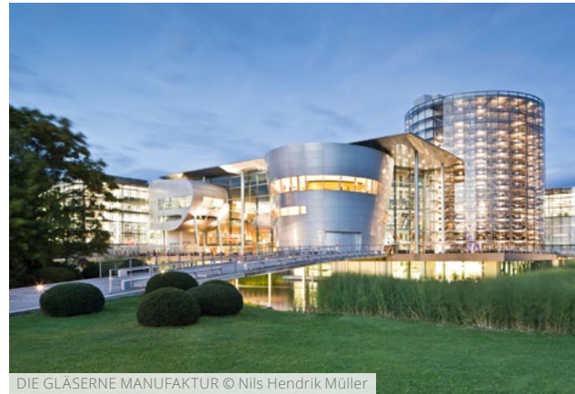
DIE GLÄSERNE MANUFAKTUR