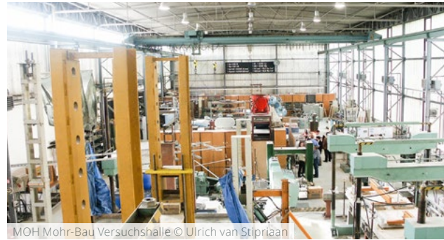
MOH Mohr-Bau Versuchshalle

09:00 Vortragsreihe 3 12:30 Mittagspause 14:00 Vortragsreihe 4 15:30 Ende des Kolloquiums*